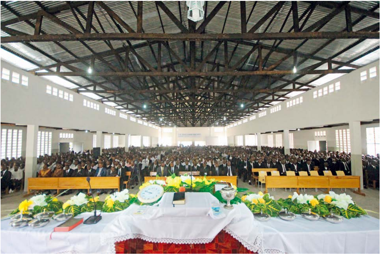
▲新教堂内景。有 19000 人在此聚集。