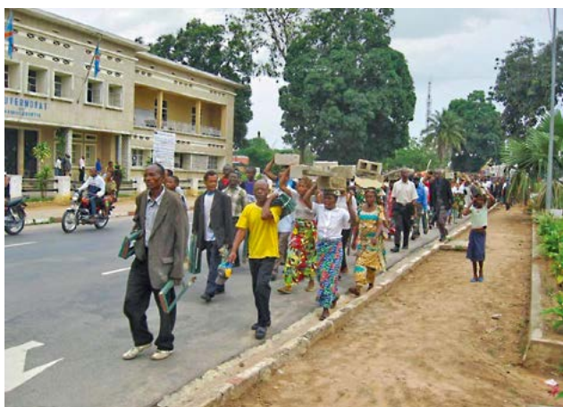
▲下图：在新教堂的工地上，信徒协助施工